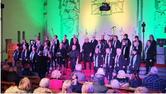
Gospelchor Together Neuss 2024

der Gospelchor Together musikalisch begleitet. Mehr über den Chor ist unter www.gospelchor-together zu erfahren.